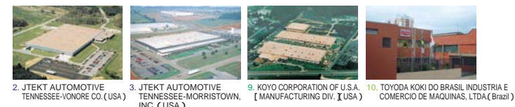
2. JTEKT AUTOMOTIVE TENNESSEE-VONORE CO. (USA) 3. JTEKT AUTOMOTIVE TENNESSEE-MORRISTOWN, INC. (USA) 9. KOYO CORPORATION OF U.S.A. [MANUFACTURING DIV. ] (USA) 10. TOYODA KOKI DO BRASIL INDUSTRIA E COMERCIO DE MAQUINAS, LTDA. (Brazil)