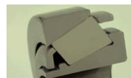
低トルク高性能円すいコロ軸受開発(回転トルク1/5化)