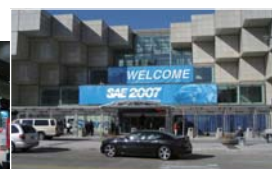
SAE SHOWで最新技術を紹介