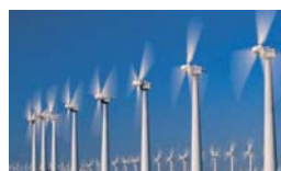
風力発電 「主軸」発電機「用軸受」で当社製品を使用