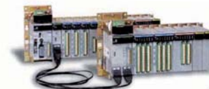
オンリーワンの安全PLC 欧州の厳しい各種認証テストに合格

また、基礎技術の深化と技術のシステム化、融合により、安全で安心、快適で省エネ、環境にやさしい商品開発・提供という形で当社は社会のお役にたっています。