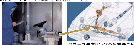
パワーステアリングの耐寒テスト