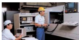
研削盤の性能評価事例