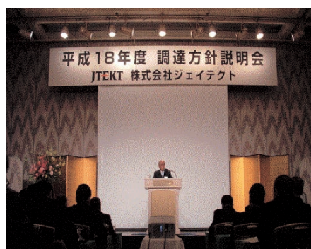
ジェイテクト調達方針説明会(2006.4.6)

その中で、当社の環境取り組みとして、CO 2 の削減や化学物質の管理、廃棄物の削減などの活動により、環境にやさしいモノづくり企業を目指すことをお伝えするとともに、各社様へご協力をお願いしました。