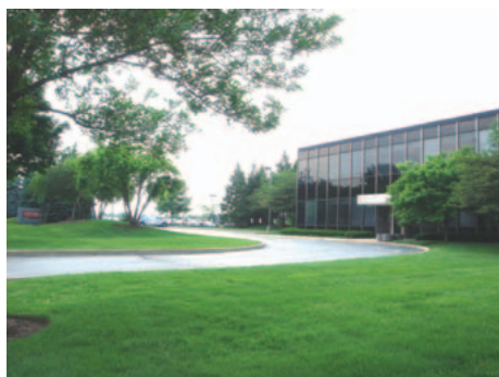
TMU 本社 (イリノイ州)

今後は、全米に納入されている 5 000 台を超える既設機の実績を確実にいき顧客満足度を高めるとともに、商品ラインナップをさらに充実させ、米国にとどまらず、カナダ、メキシコでも積極的に活動し、ますますの事業拡大を図って行きます。また TMU は、JTEKT 工作機械事業部の海外現地法人のリーダーとして、欧州の TME 社、TMEE 社、ブラジルの TKB 社、中国の TMD 社、タイの TMSEA 社と連携を取り、世界中の JTEKT のお客様をサポートしていきます。