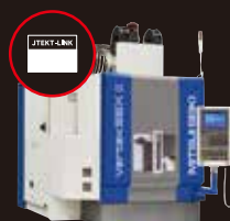
- 他社製工作機械 -