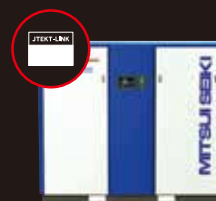
- その他設備 -