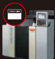
- 研削盤 -