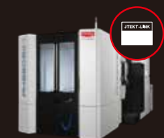
- マシニングセンター -